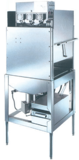
Máquina Lavalozas L-Series

Corner inside sump with built-in scrap accumulator