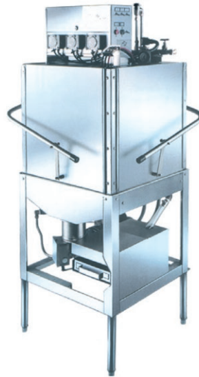
Máquina Lavalozas "L" - Series